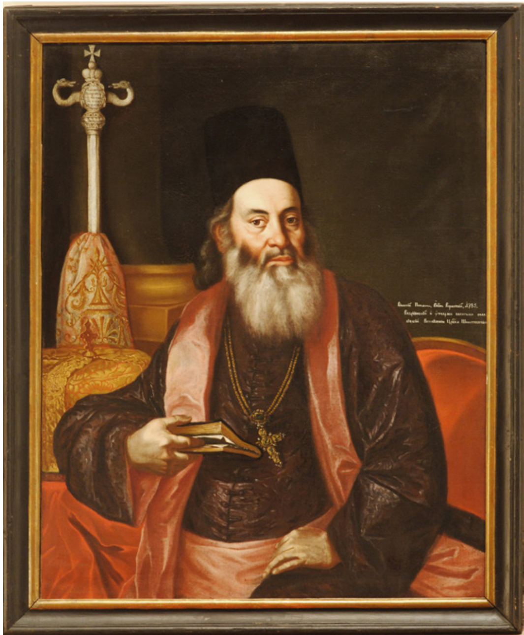
Сл. 7. Викентије Појовић, 1785, датирано, није потписано, Музеј Српске православне цркве, Београд (стална поставка Галерије Матице српске)