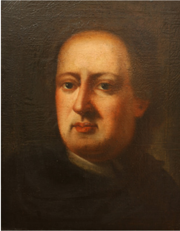
Сл. 6. Порџреџ младоџ човека , 1780–1796, није потписано и датирано, Галерија Матице српске

први је писао Павле Васић (1959: 68–69): „Судећи по типовима, фризури и оделу, ове слике потичу из прве половине XVIII века. Међутим, у општој концепцији ових портрета налазе се елементи стила чешког портретисте Јана Купецког [...], који је уживао велики глас у земљама Средње Европе у XVIII веку.” Васић даље наводи да је Купецки био у Пожуну између 1725. и 1730, уочавајући да на Мушком њорџреџу (ГМС/У 1316) има извесних детаља који сведоче у прилог могућем Нешковићевом ауторству, износи претпоставку да је можда могуће да се ради о копији аутопортрета мајстора пожунске школе код којег је Нешковић учио. Поредећи овај портрет са Ауџџорџреџом , те оба са другим, Порџреџом младоџ човека (ГМС/У 1317), за који каже да га је сликао „мајстор моделације и сфумата”, закључује да је потоњи рад страног мајстора, или да је Нешковић „у пожунској средини под утицајем снажнијих