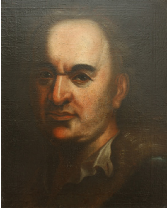
Сл. 5. Мушки ѿортрети, 1780–1796, није потписано и датирано, Галерија Матице српске