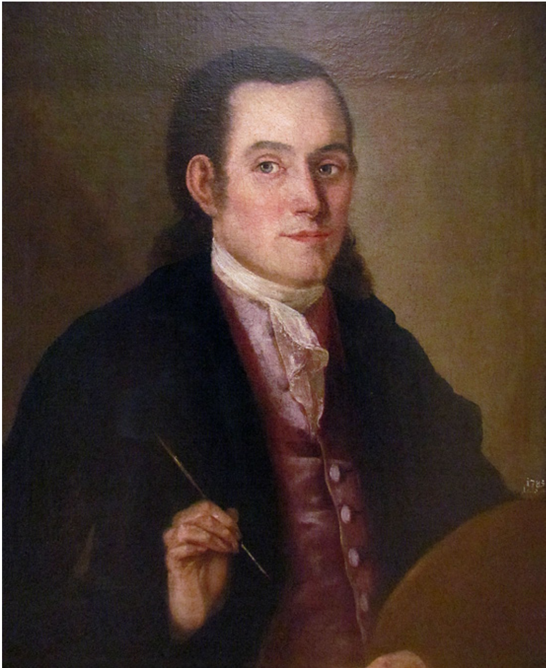
Сл. 1. Аутопортрет , 1785, датирано, није потписано, Народни музеј у Београду