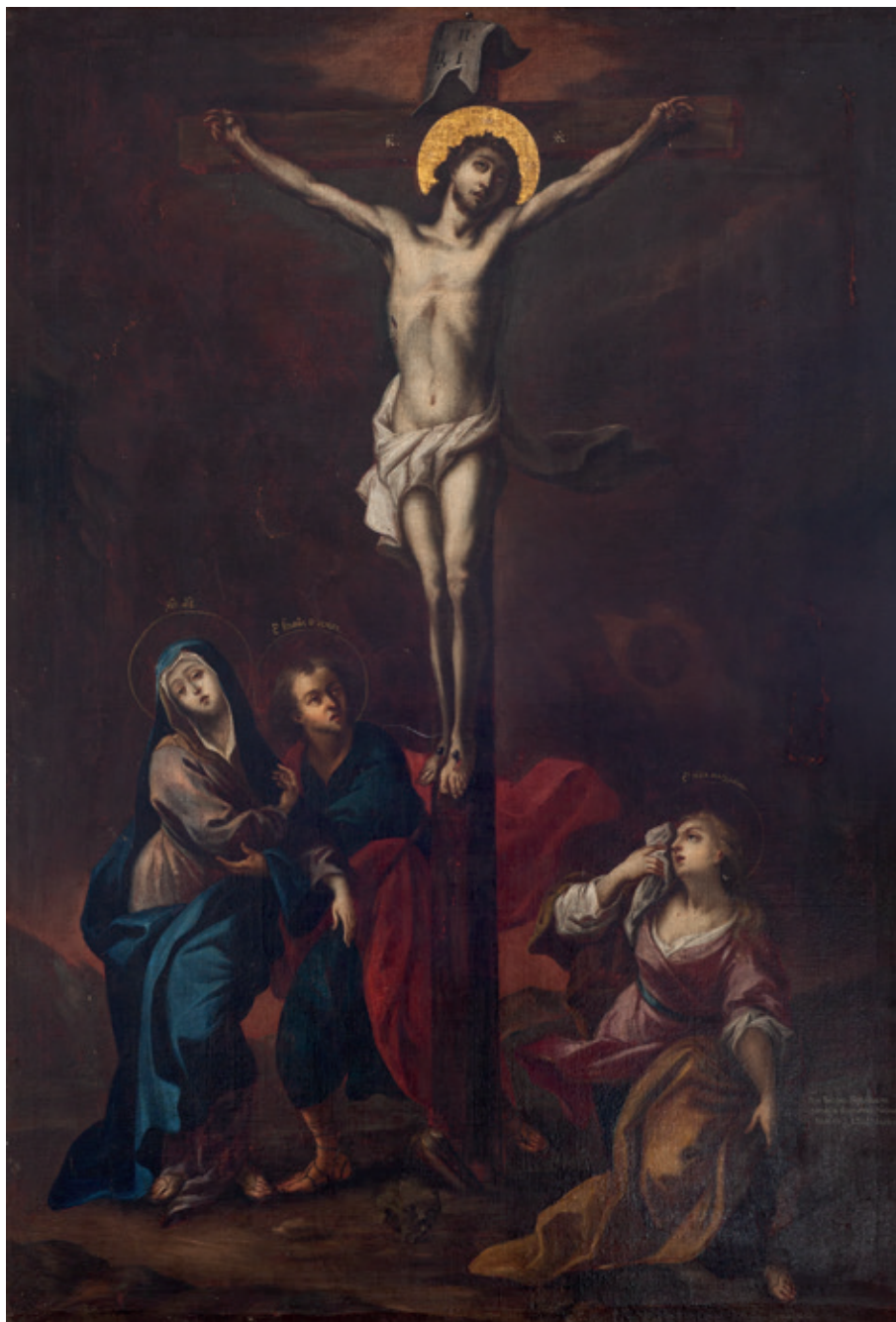
Сл. 4. Распеће , 1792, потписано и датирано, Српска православна црквена општина, Загреб