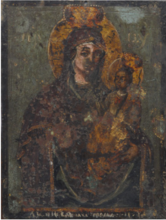
Сл. 2. Бојородица са Христџом , 1785, потписано и датирано, Галерија Матице српске

имена Нешковића као аутора на више места налазе упитници. С обзиром на то да се године у којима је Нешковић (рођен је у Пожаревцу око 1729) не слажу са годинама у којима је приказана особа на слици, пласирана је теза да је портрет настао око 1760, а да се уписана година односи на годину Нешковићеве смрти (сл. 2). 3